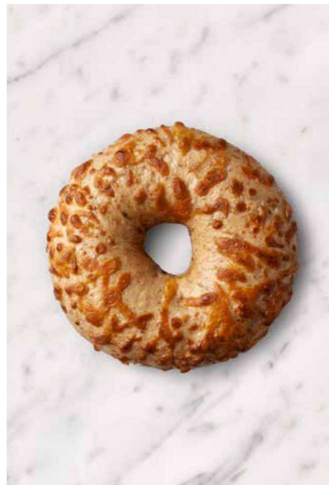
MISS BAGEL FULDKORN CHILI CHEDDAR Fuldkorn med bid – En bagel med krydret karakter!

Oplev vores Chili Fuldkorn Bagel, der er en robust og smagfuld bagel, bagt med fuldkorn og et strejf af chili, som giver en let varme og et krydret twist. Denne bagel er ideel for dig, der elsker en klassisk bagel med et moderne pift og ekstra mæthed fra fuldkornsmelet.