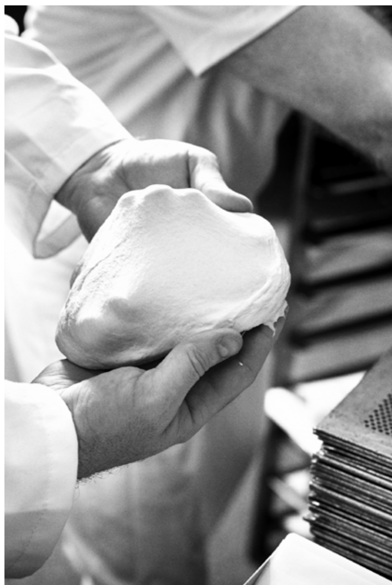
Perfektionering af det simple