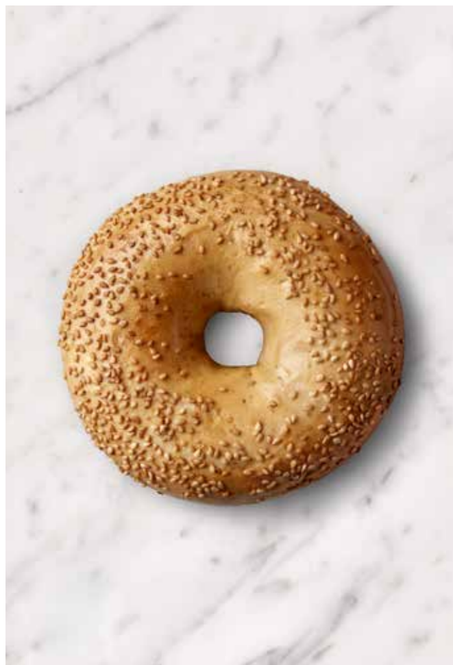
MISS BAGEL SESAM Sprød og smagfuld - Klassikeren med et twist!

Få en smagsoplevelse med vores lækre Sesam Bagel, som er drysset med ristede sesamfrø for en let nøddeagtig smag og en ekstra sprød tekstur. Perfekt til morgenmad eller som base til en fyldig sandwich – denne bagel er en favorit hos mange!