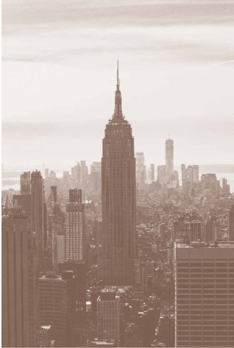
New York - Danmark Siden 2000