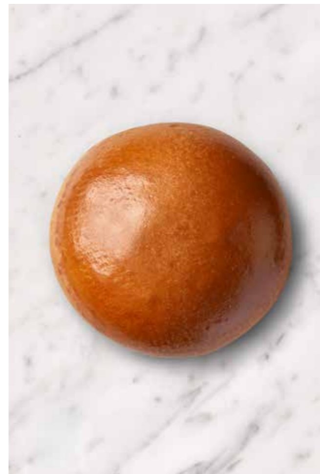
MISS BAGEL BRIOCHE BURGERBOLLE Vores mest populære burgerbolle - Bagt med smør!

95g XL (Ø12-13) 18 stk. Varenr. 407818 Foodservice 80g (Ø10-11) 24 stk. Varenr. 407801 Foodservice