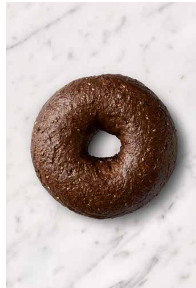
MISS BAGEL FULDKORN RUG Rig på smag og fibre – En mættende oplevelse!

Vores Fuldkorn Rug Bagel er lavet med nærende fuldkorn og rugmel, hvilket giver en dyb og rig smag samt en dejlig mættende konsistens. Bagelen er et sundt valg til dig, der elsker en mørkere bagel med mere fylde og fiber. Den er perfekt til en solid morgenmad eller frokost.