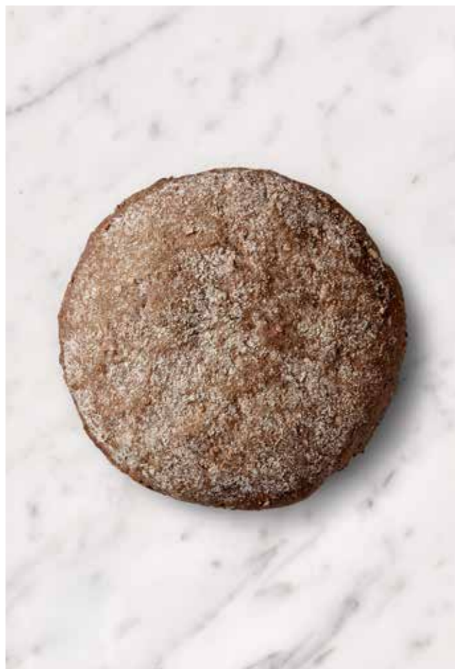
MISS BAGEL BURGERBOLLE FULDKORN XL Vores grove burgerbolle med sprødt bid og blød krumme

Vores burgerboller er bagt i Danmark med rene råvarer, uden brug af konserveringsmidler eller andre tilsætningsstoffer. Vores burgerboller er bagt med mindst 7% ægte smør. Det giver brødet sin helt egen tekstur, duft, bid og krumme. Det vil du opleve er en helt anden oplevelse end den traditionelle burgerbolle bagt på olier og smør-aroma. Prøv bare! Alle vores boller leveres på frost for at bevare brødets struktur "fra bageri til bord" og for at mindske madspild.