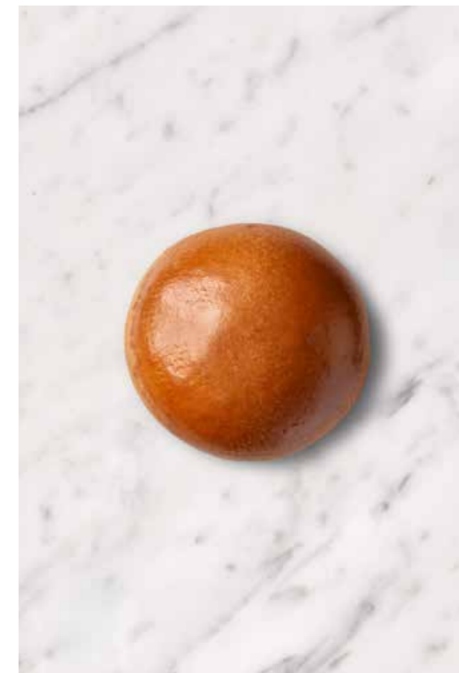
MISS BAGEL BRIOCHE BURGERBOLLE SLIDER Lækker lille slider - Bagt med smør!

95g XL (Ø12-13) 18 stk. Varenr. 408063 Foodservice 80g (Ø10-11) 24 stk. Varenr. 408083 Foodservice