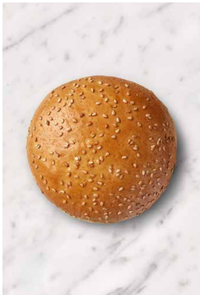
MISS BAGEL BRIOCHE BURGERBOLLE SESAM Blank smørbagt burgerbolle toppet med sesam

100g XL (Ø11-12) 24 stk. Varenr. 40610050 Foodservice