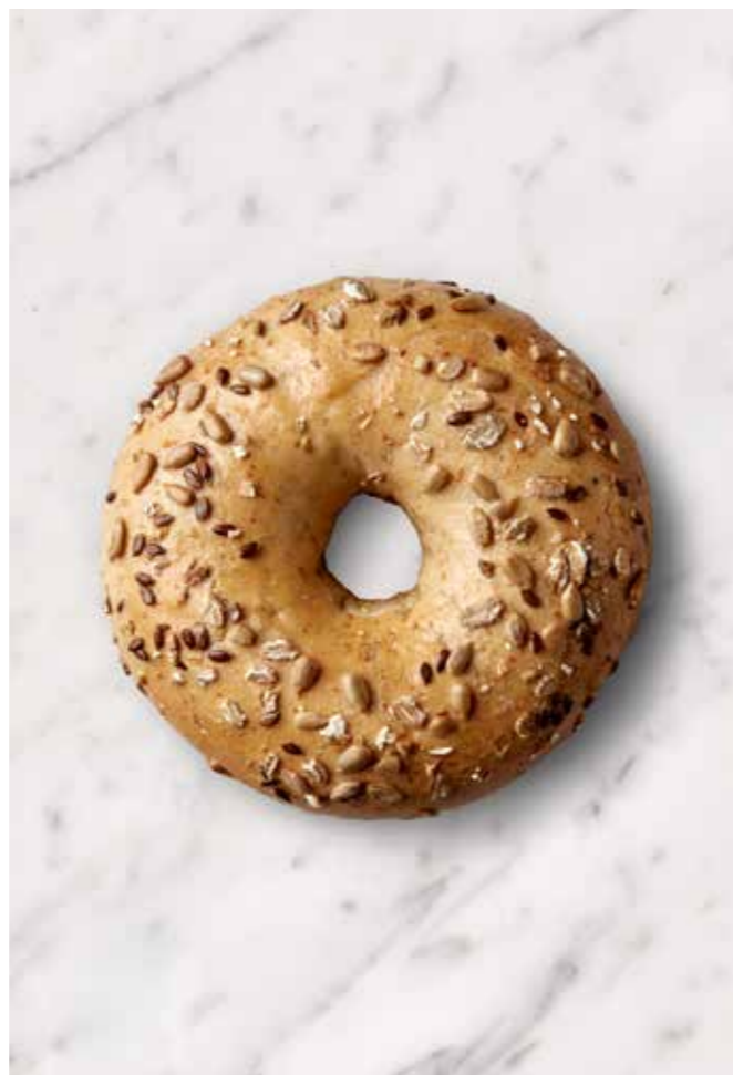
MISS BAGEL GROV Fyldig og nærende – En sund start på dagen!

Vores Grov Bagel er perfekt til dem, der søger en mere fiberrig og mættende bageloplevelse. Lavet med en blanding af rugflager, solsikkekerner og hørfrø, har bagelen en rig, nøddeagtig smag og en skøn, sprød tekstur, der er ideel til en sund og lækker start på dagen!